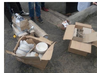
Подарили 100 наборов посуды