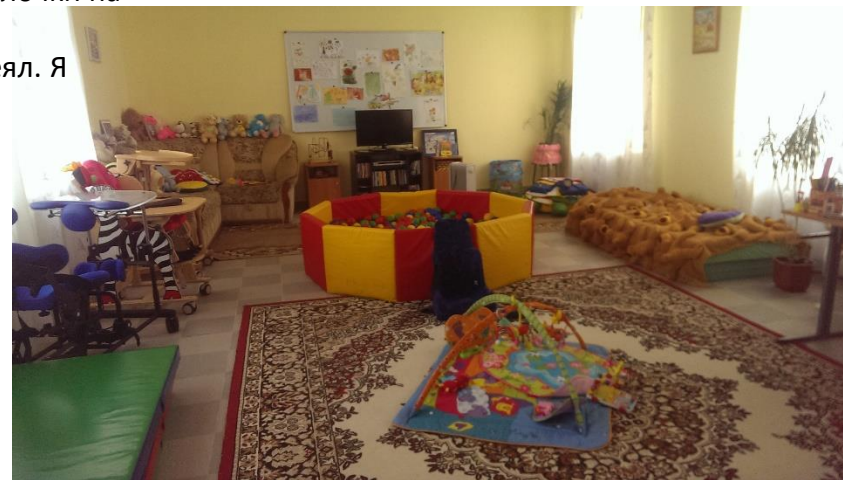
Комната терапии для детей

У нас был хороший визит , но мы ушли с печальными сердцами.