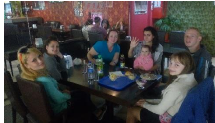
...Ужин в Ильичевск с некоторыми выпускниками ...