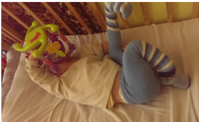
Кристина (около 9 лет) стеснясь нас когда мы навещали.