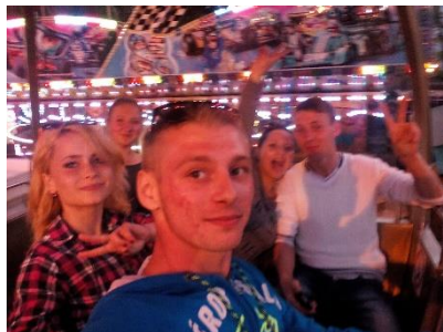
...взяли несколько детей на качели в парке ...